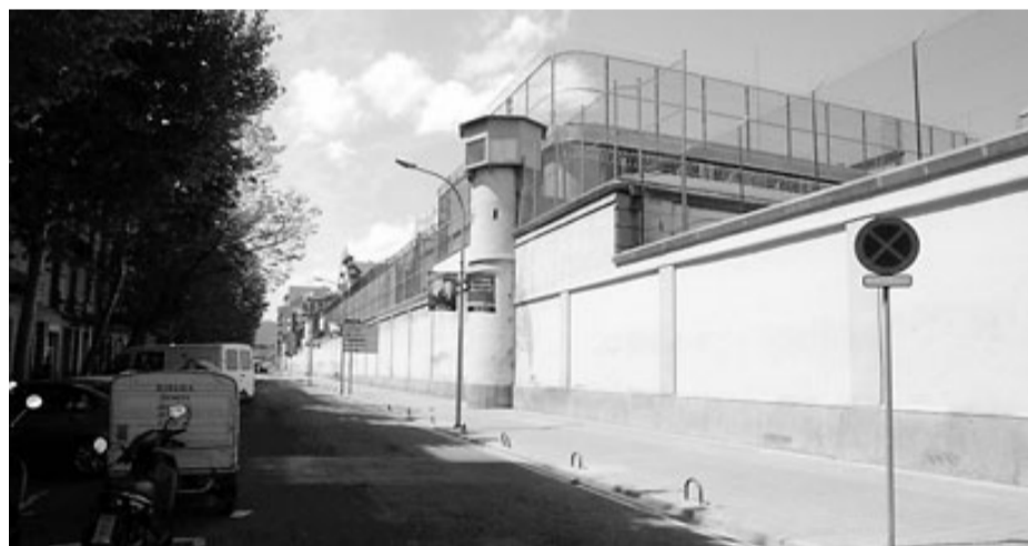
Un dels murs que envolten el recinte del centre penitenciari.