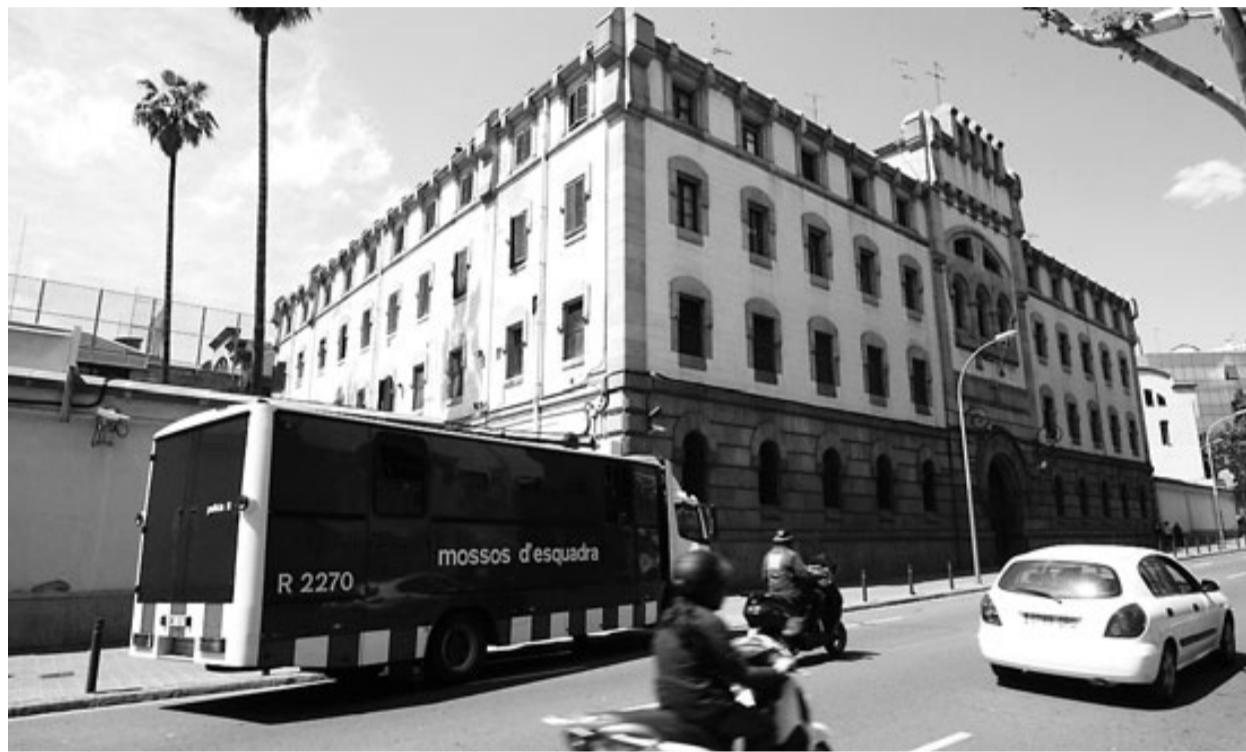
L'entrada principal a la presó Model, al carrer Entença.

A partir de la informació que van rebre els veïns, una altra de les previsions